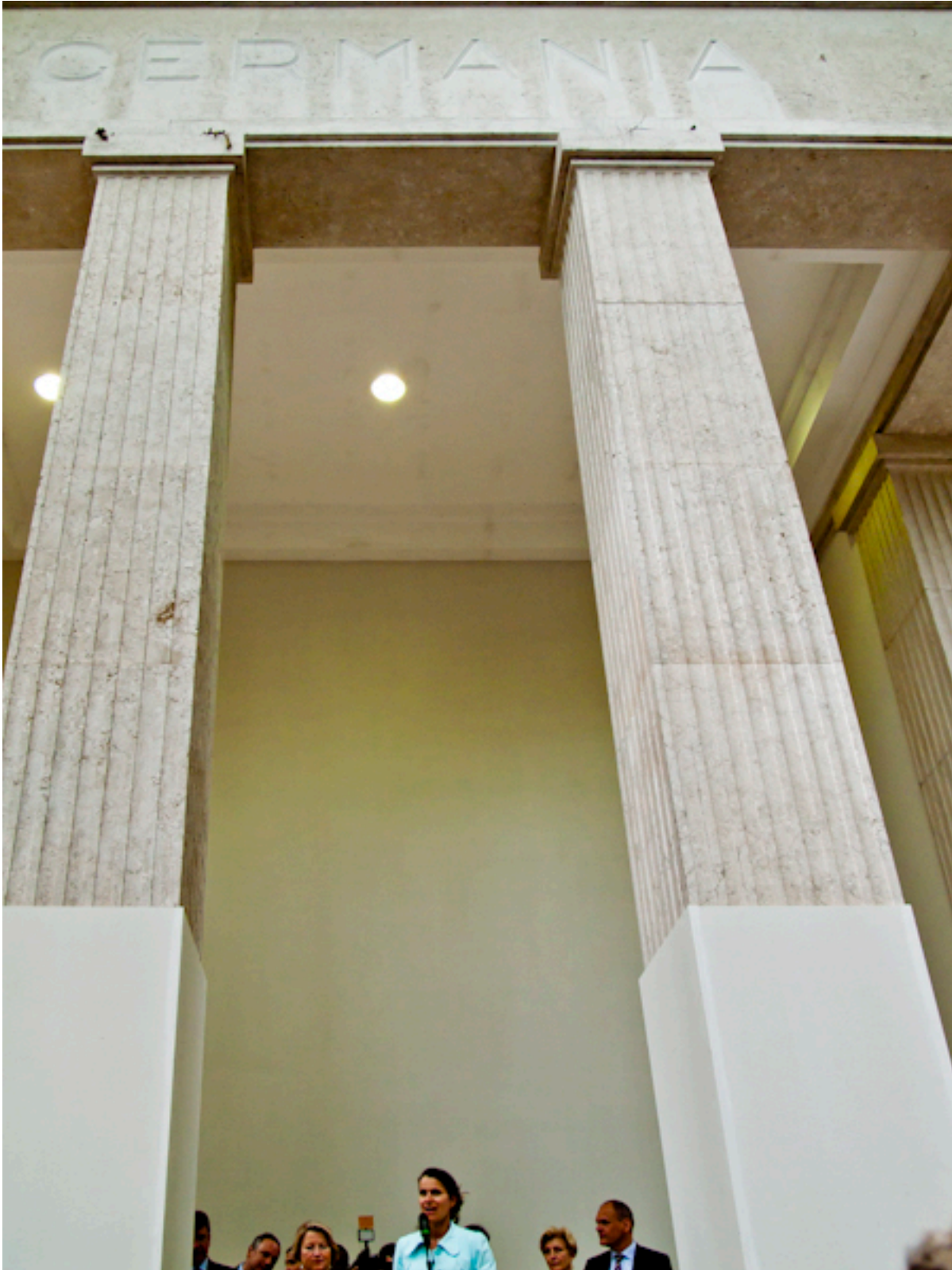
Aurélie Filippetti, Ministre de la Culture et de la Communication (r.), Cornelia Pieper, Staatsministerin im Auswärtigen Amt (l.)

Die Kunst-Biennale 2013 in Venedig ist eine Überraschung.