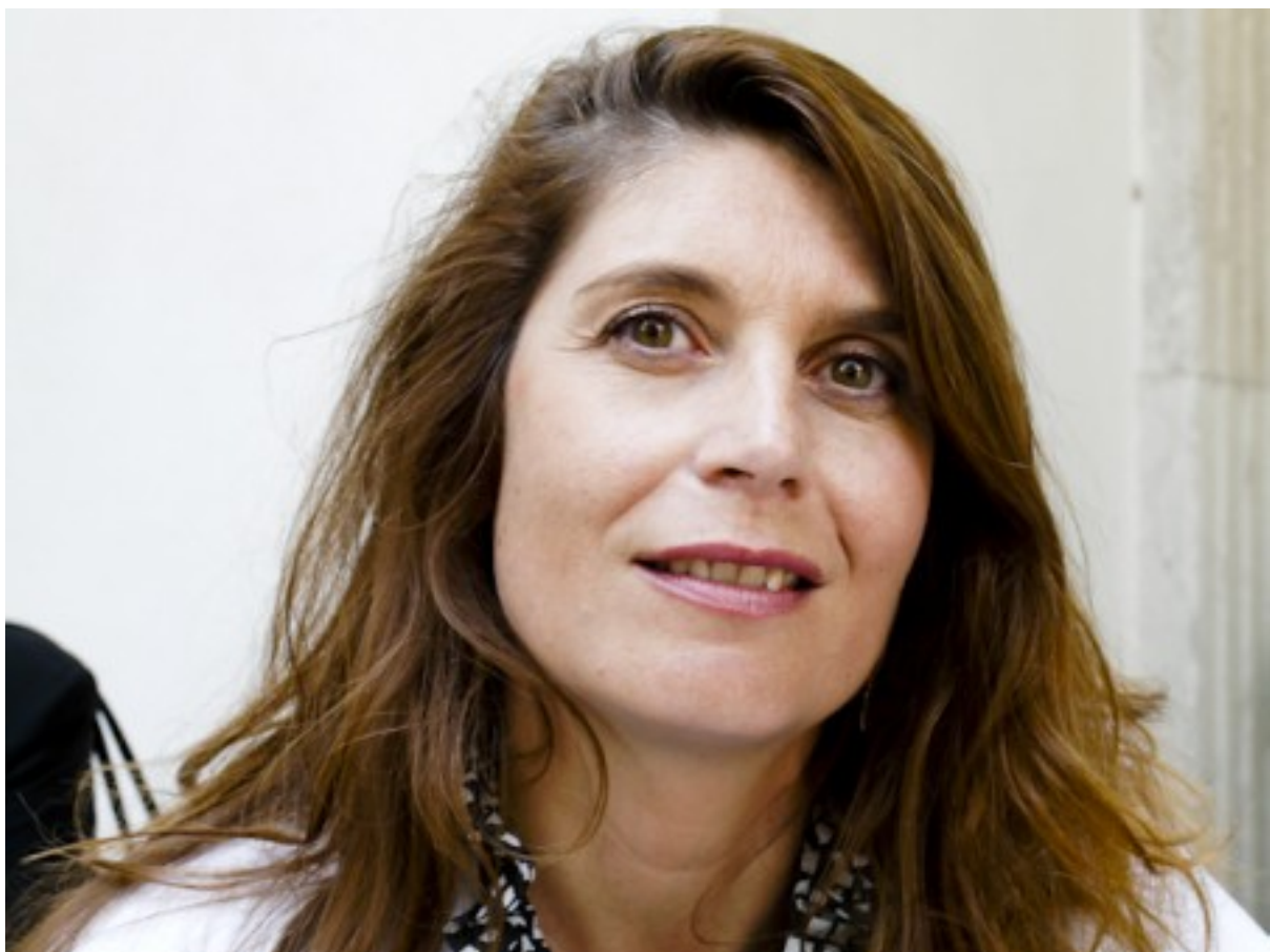
Christine Macel

Anri Sala, 1974 in Tirana geboren, besuchte die Kunstakademie Albaniens, die l'Ecole Nationale Supérieure des Arts Décoratifs in Paris und das Studio Le Fresnoy. Neben Ausstellungen im Musée d'art moderne de la Ville de Paris, Kunsthalle Wien, Museum of Contemporary Art North Miami, Serpentine Gallery, MoMA und Centre Pompidou, trat Sala auf verschiedenen Biennalen in Erscheinung: in Venedig, dort erhielt er den Preis als junger Künstler, Moskau, Sao Paulo, Sydney und Berlin.