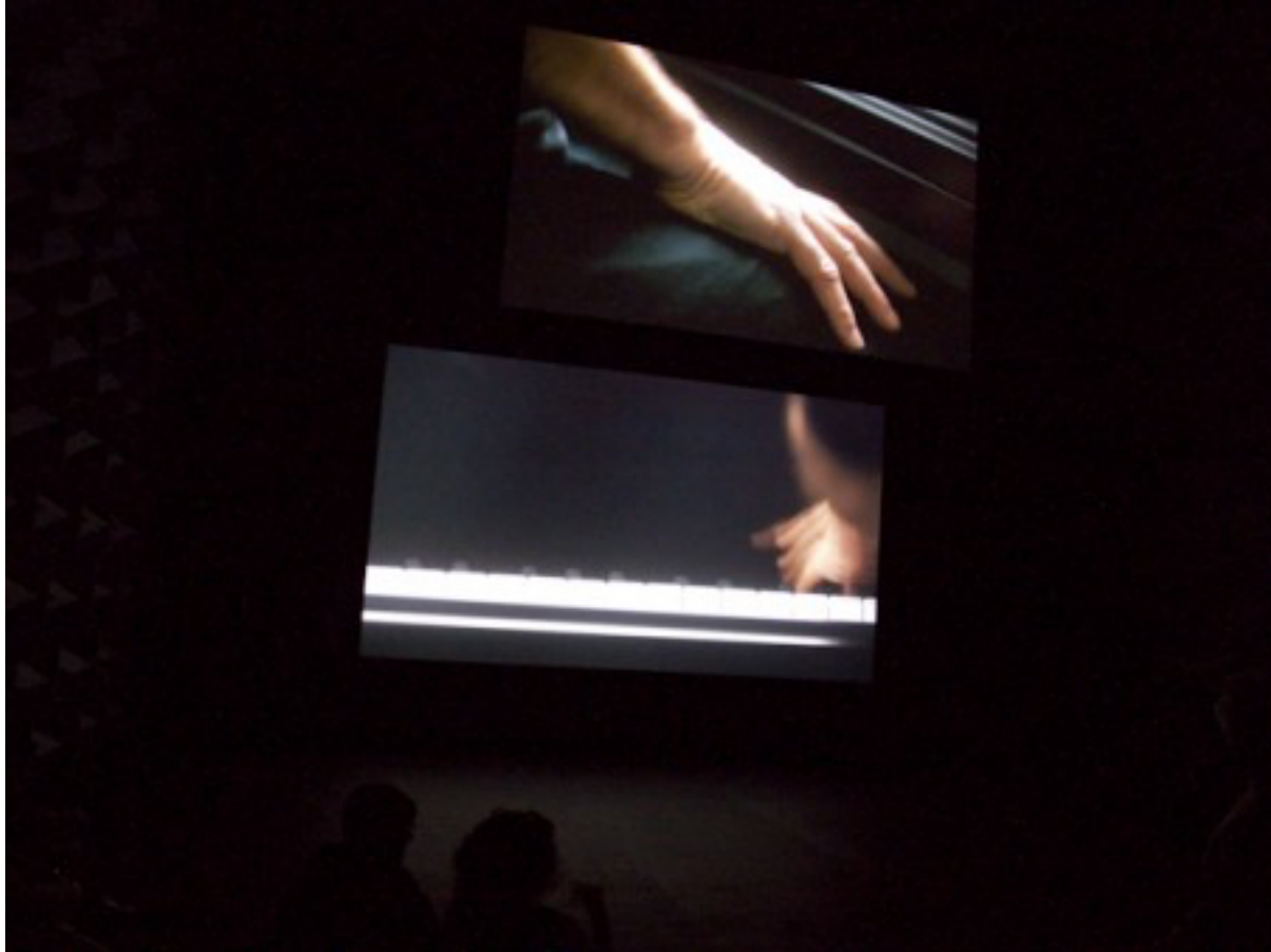
Anri Sala "Ravel Ravel Unravel" (détail)

Unter "Ravel, Ravel, Unravel" führt er in dem deutschen Pavillon mit emotionaler Intellektualität künstlerisch vor, wie diese historisch belastete Architektur doch gelebt werden kann, ohne Geschichtsklitterung zu begehen oder die damalige Zeit zu entpolitisieren, zu ignorieren. Allerdings: Maurice Ravel, keine leichte Muse, ernst, dramatisch, aber nicht belastend, wie die Fassade des Gebäudes.