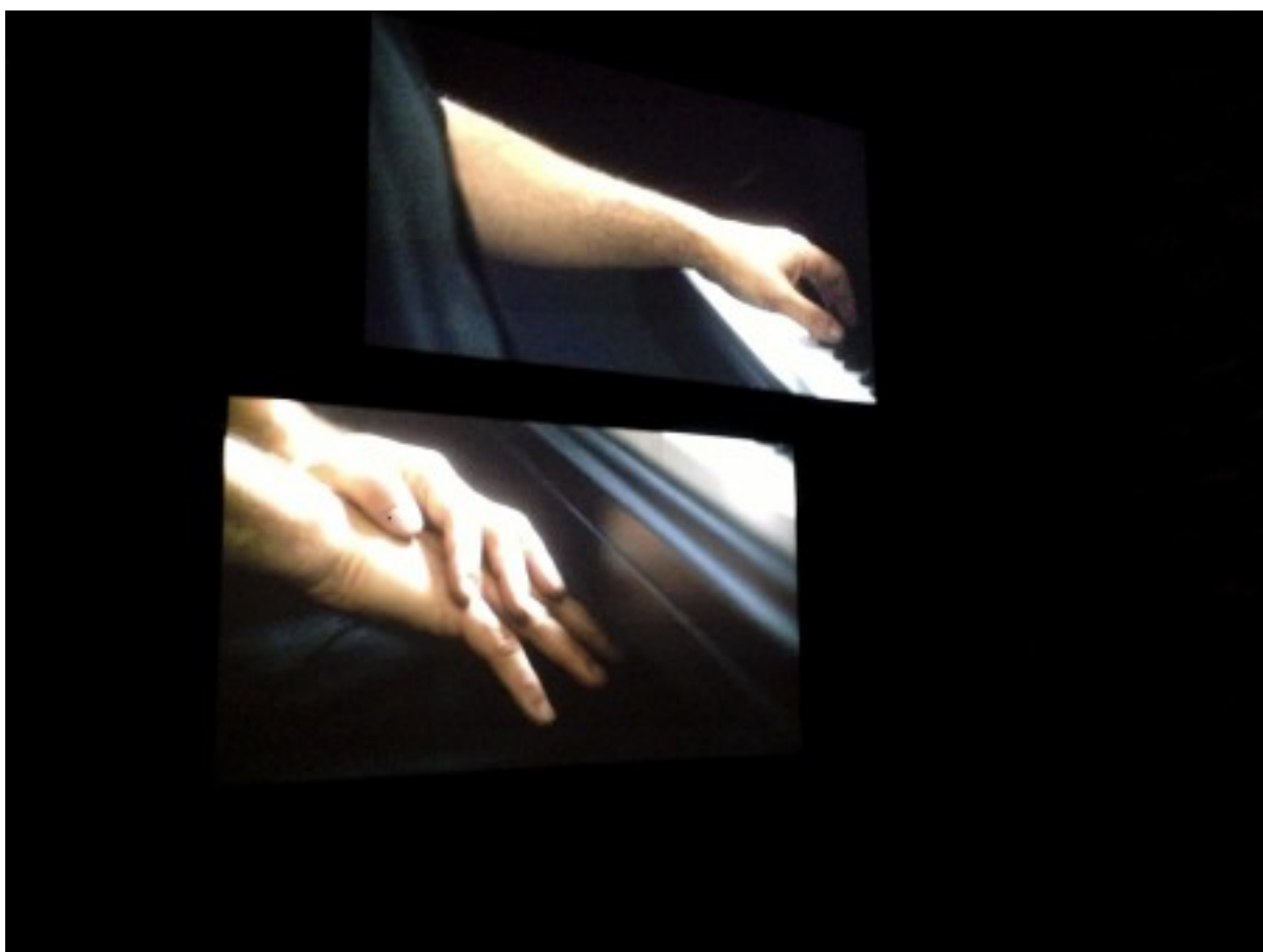
Anri Sala "Ravel, Ravel, Unravel" (détail) - © Burkhard Maus

Unter "Ravel, Ravel, Unravel" führt er in dem deutschen Pavillon mit emotionaler Intellektualität künstlerisch vor, wie diese historisch belastete Architektur doch gelebt werden kann, ohne Geschichtsklitterung zu begehen oder die damalige Zeit zu entpolitisieren, zu ignorieren. Allerdings: Maurice Ravel, keine leichte Muse, ernst, dramatisch, aber nicht belastend, wie die Fassade des Gebäudes.