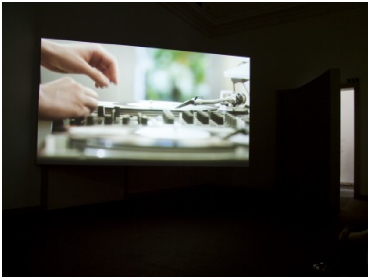
Anri Sala "Ravel, Ravel, Unravel" (détail)

So ließe sich auch die Architektur des deutschen Pavillons aushalten, das Originäre bliebe zwar, aber käme in einem anderen Gewande daher. Und der "Lack" wäre zwar abgekratzt ("ravel"), das Niveau aber gestiegen, durch Anri Sara, seiner Kunst – und durch Frankreich.