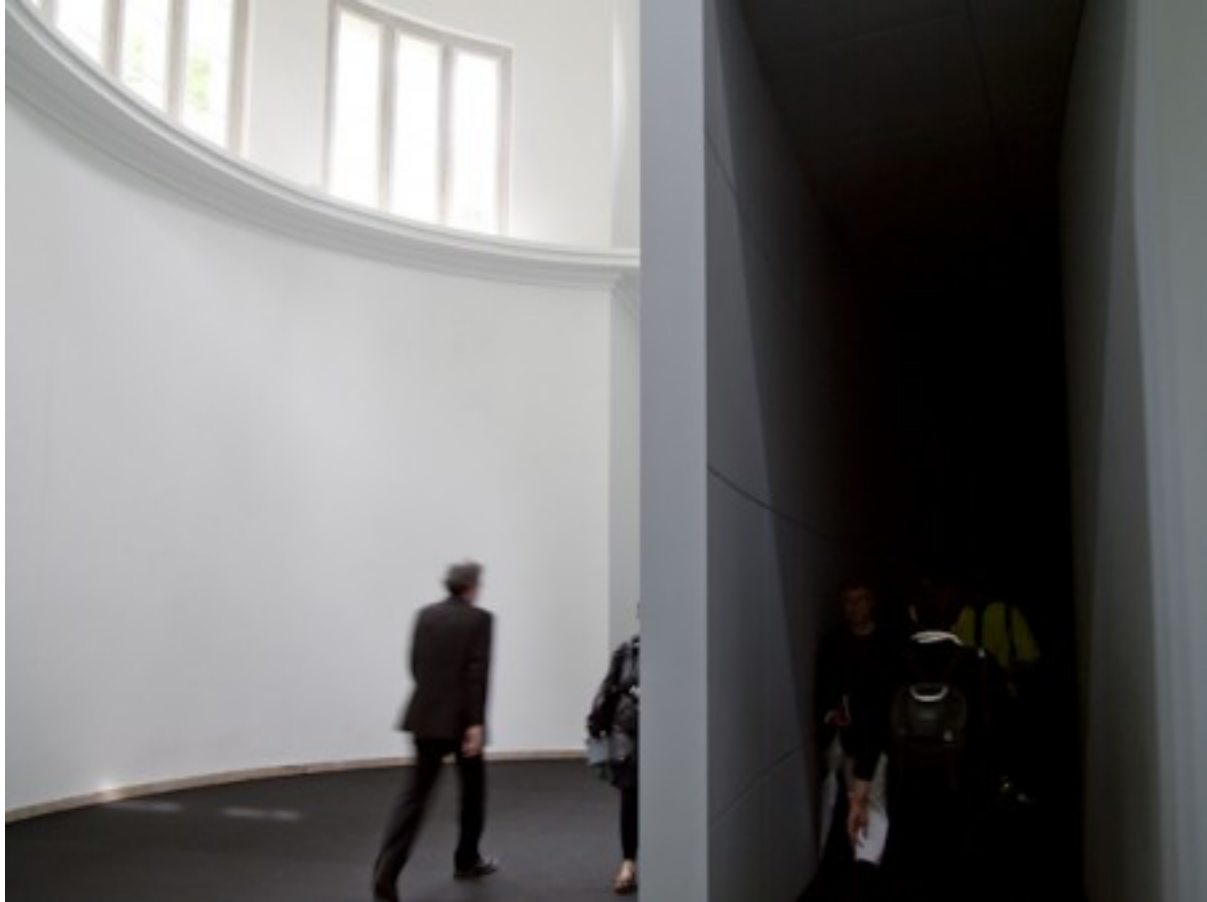
Anri Sala "Ravel, Ravel, Unravel" (détail)