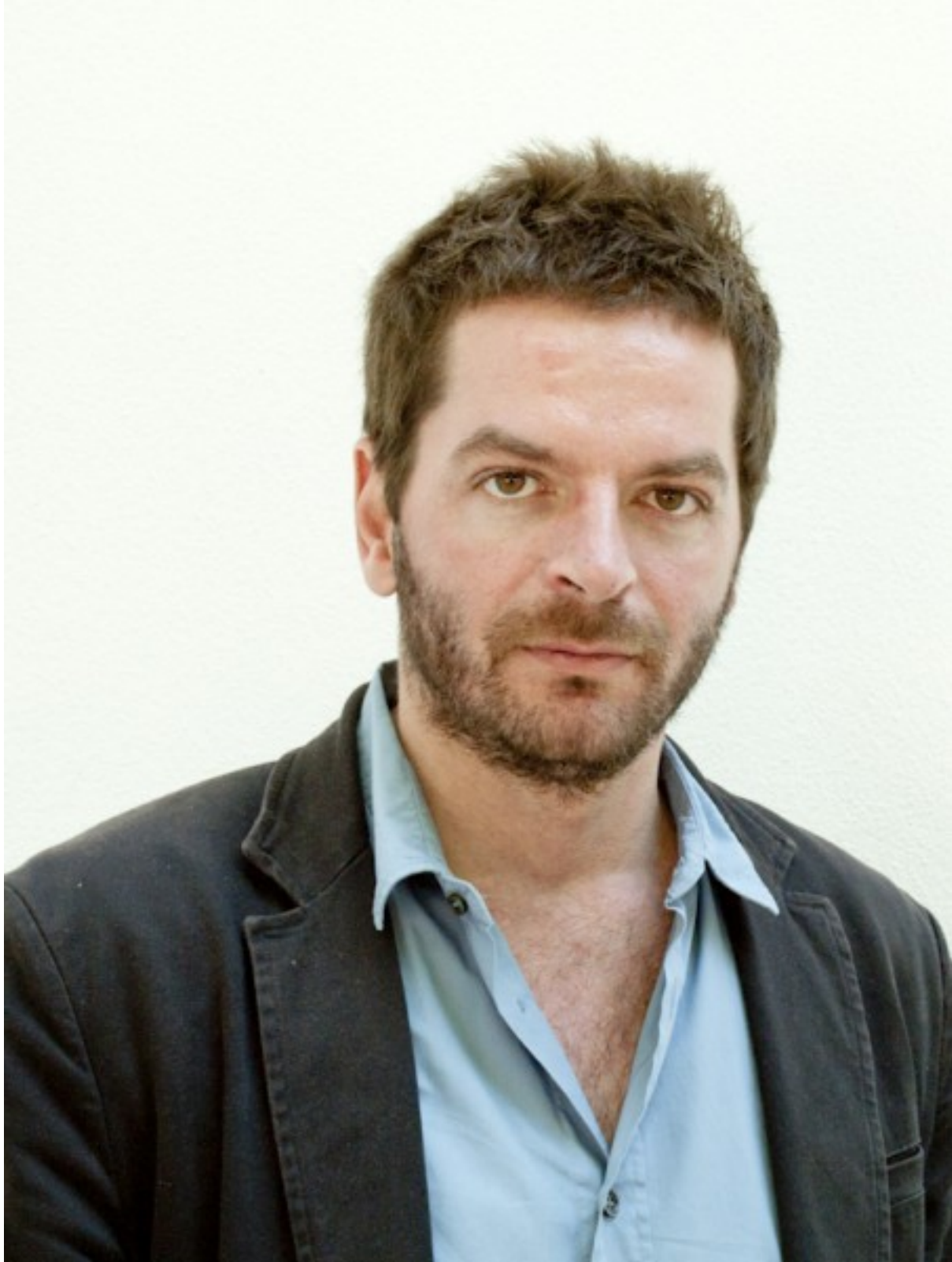
Anri Sala - © Burkhard Maus